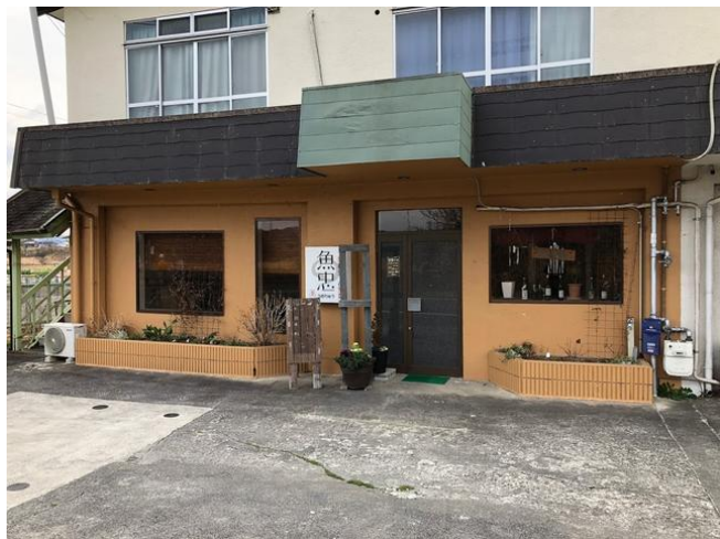
東町 丸正ビル 店舗A